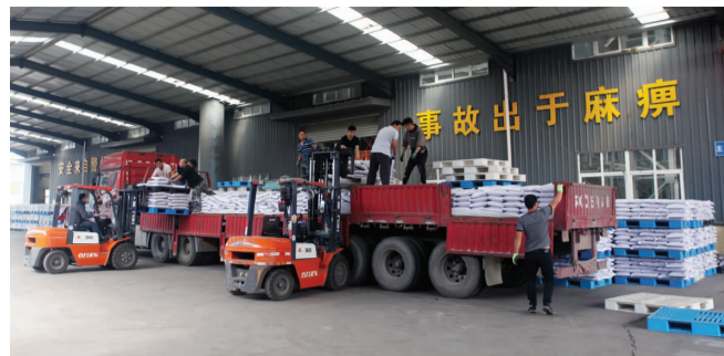
为保障客户正常生产,供销、国贸公司“双节”保供不停歇,该公司召开保供专题会议,制定保供工作方案,周密组织安排发运,假期 8 天供应工业盐 2000 吨、石灰石 4600 吨、煤炭 2000 吨,另出口 200 余吨石榴子石已经完成备货,将于近期安排出口相关事宜。(王道武)