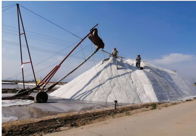
10月6日上午11时，随着马二份九组一单元最后一斗盐上库，徐圩投资公司秋扒“战役”胜利收官。秋扒“战役”历时31天，完成20个单元的秋扒任务，共计扒盐总量11400余吨。（卜长军）

废。强化考核，着力提升产品质量。严格执行工艺纪律，突出对关键质量工序的把控力度，加强考核检查。突出设备管理，做好设备的日常维护和检修工作。强化产品全方位“三级检验”制度，根据产品检测信息及时调整生产参数，优化生产工艺。加强班组和员工的质量培训，推动产品质量再上新台阶。根据消费者需求，发挥海盐差异化优势，合理调整产品结构，根据客户需求及时调整小包装产品的生产规格，提高盐产品附加值，打造金桥制盐特色的高端产品。（金宣）