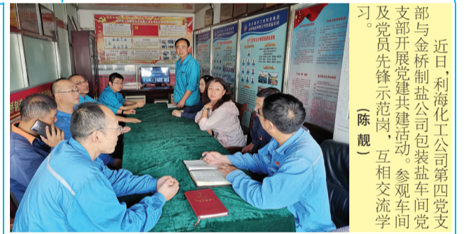
近日，利海化工公司第四党支部与金桥制盐公司包装盐车间党支部开展党建共建活动。参观车间及党员先锋示范岗，互相交流学习。(陈舰)