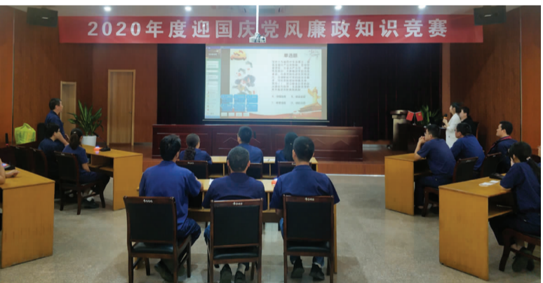
为进一步贯彻落实全面从严治党要求，扎实营造“学党纪、知规矩、明底线”的氛围，日前，寰纶公司举办党风廉政建设知识竞赛活动，6个党支部、18名党员参加了比赛，内容涉及《党章》《中国共产党问责条例》《中华人民共和国监察法》《中华人民共和国公职人员政务处分法》等知识。(寰纶 宣)

善。排查安全风险。对进场施工人员进行岗前安全教育和安全培训，成立安全监管组和后勤保障组，每天保证三人对拆除现场进行全过程巡查监管和安全隐患排查。严格对照拆除清单，落实安全监管措施，现场开具安全隐患整改通知单和违反安全处罚通知单，使拆除安全细节更加具体规范，安全风险进一步有效控制。同时，对拆除可能涉及的危险性、有害性进行风险评估，制定严密的风险防控措施和应急处置预案。(杨斯杰)